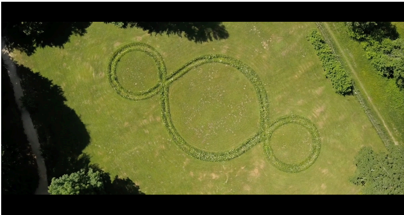
Arte Sella, Vergot Film 2023