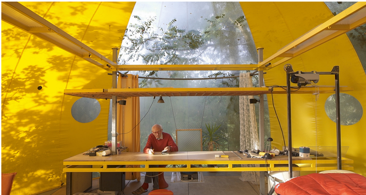
Hans-Walter Müller: Ich habe die Schwerkraft schon verlassen / ho già lasciato la gravità. Ein Film von / Un film di Lukas Schaller.