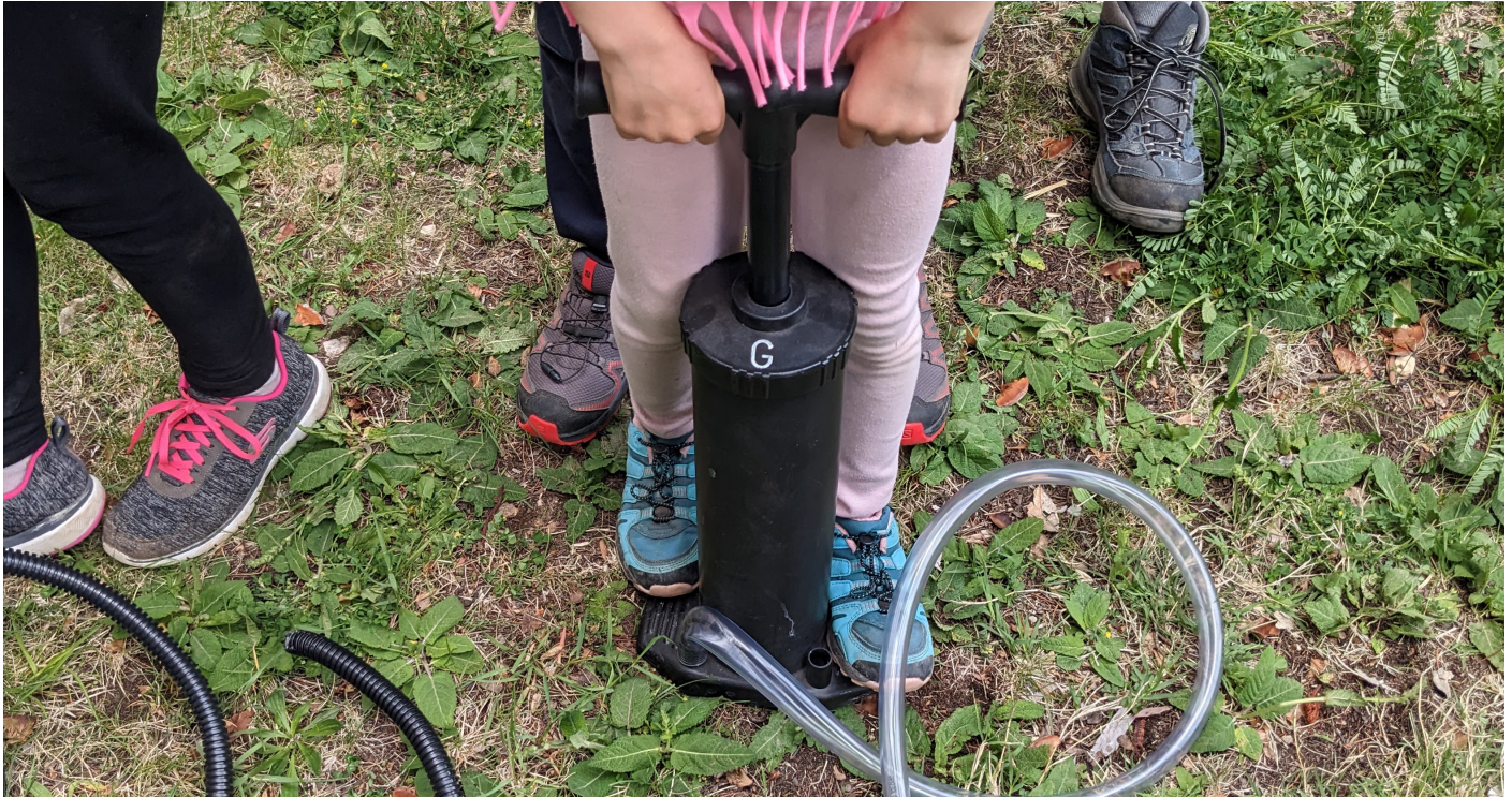
Warm up! Grundschule / Primaria Klobenstein/ Collalbo, 2023