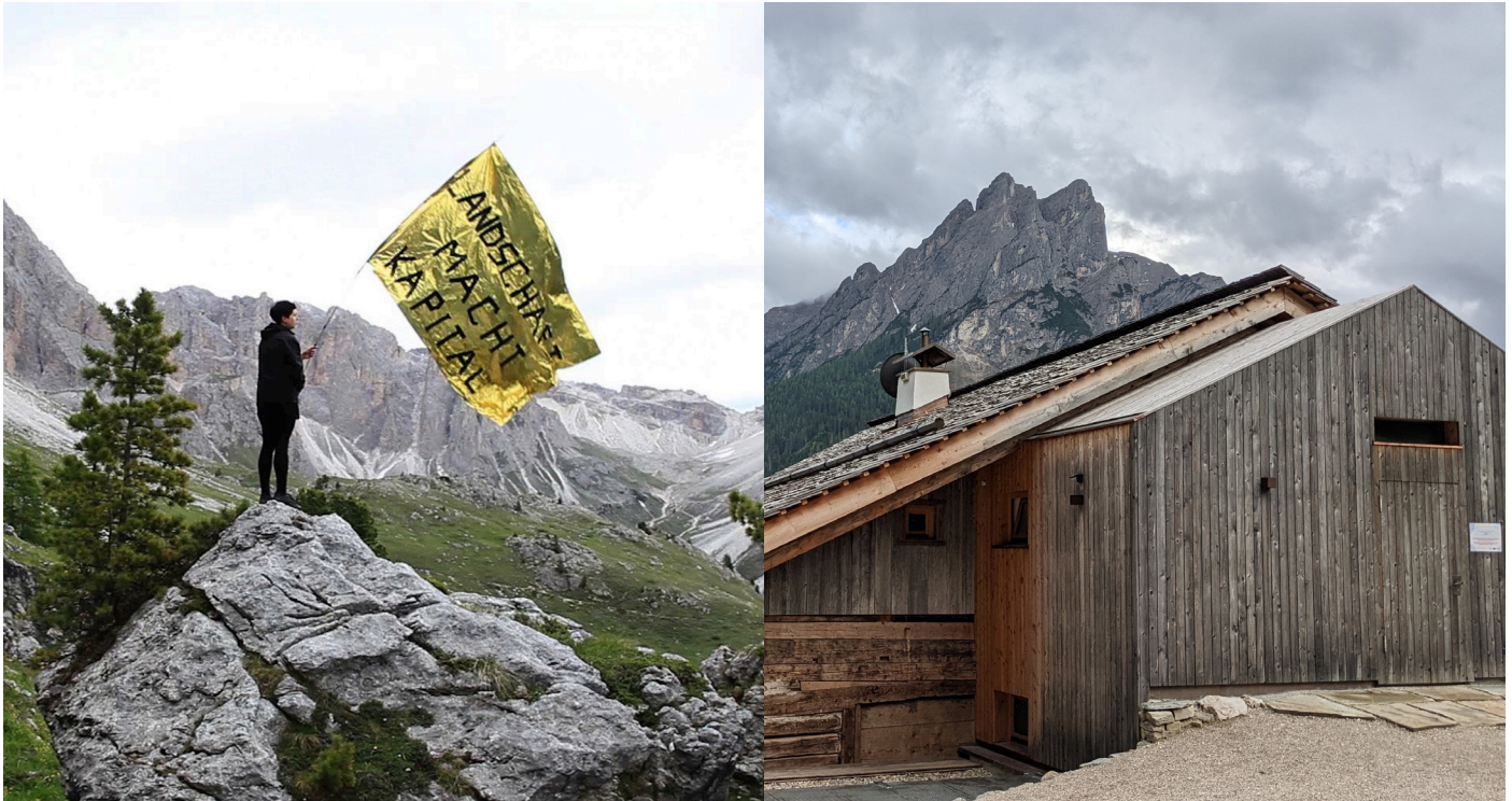
Mrova - Landschaft Macht Kapital, Video 2016