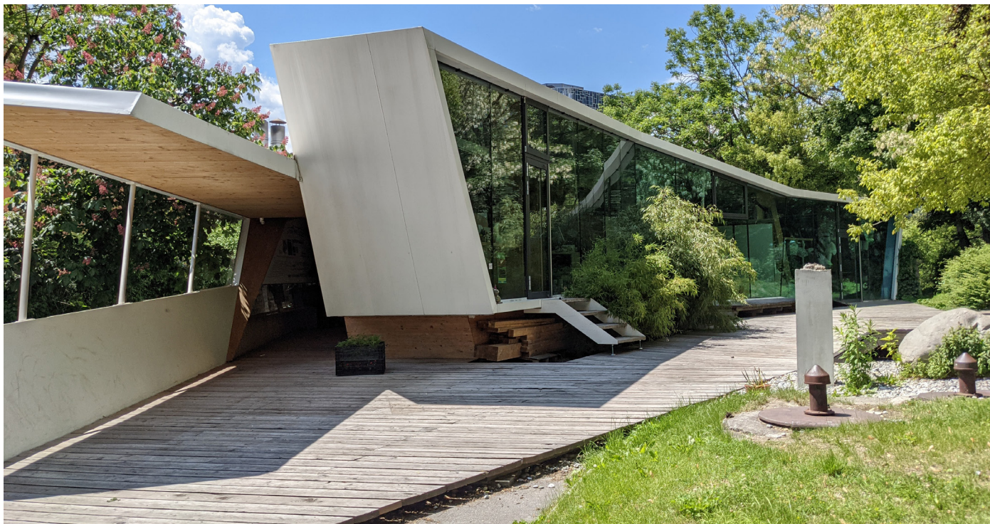
bilding Kunst- und Architekturschule, Fotocredit © G.R. Wett Scuola di Arte e Architettura di Bilding, Fotocredit © G.R. Wett