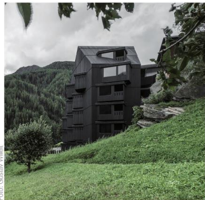
Hotel Bühelwirt von Pedevilla Architects