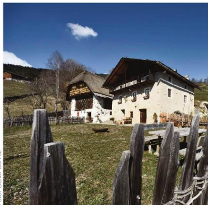
Der Felder Hof in Villanders von Studio Pavol Mikolajcak Architects.

Die Nominierungen für den 9. Architekturpreis Südtirol stehen fest. Auf der Online-Plattform kann das Publikum mitwählen.