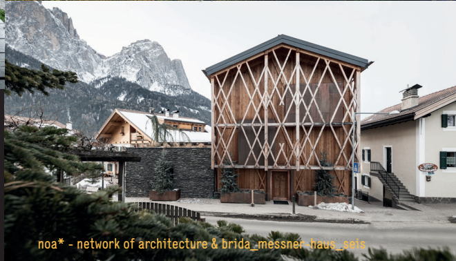
noa* - network of architecture & brida_messner_haus_bels