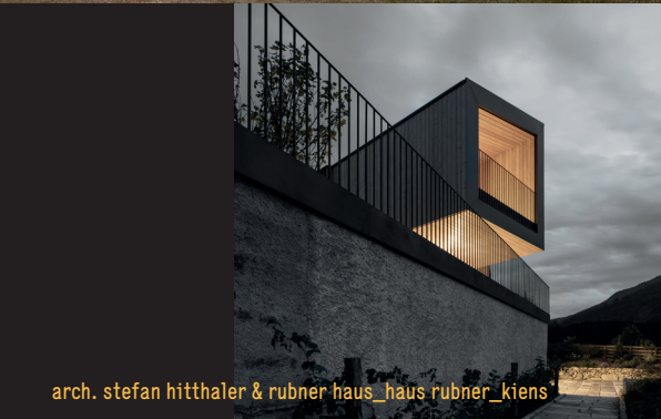
arch. stefan hitthaler & rubner haus_haus rubner_kiens