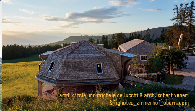
amd1 circle und michele de lucchi & arch. robert veneri & lignotec_zirmerhof_oberradein