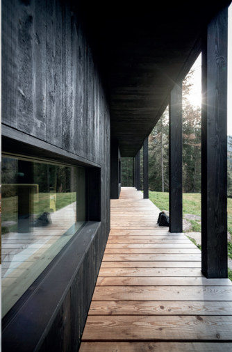
architekten mahlknecht comploi & frenerhaus almhütte d_st. ulrich in gröden