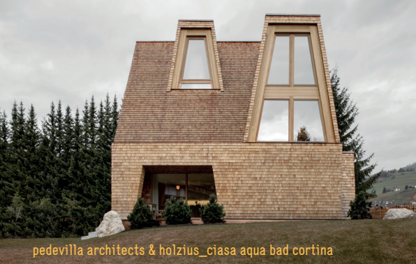
pedevilla architects & holzius_ciasa aqua bad cortina