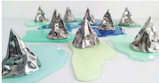
Preisträgerin 2016 Sissa Micheli - Crashed Mountain in Lake